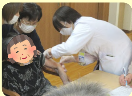
施設での予防接種

1か月間の研修を通して得た視点を今後の診療でも大切にしていきたいと思います。貴重な学びの機会をいただき、本当にありがとうございました。