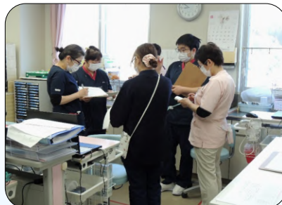
病棟での情報共有